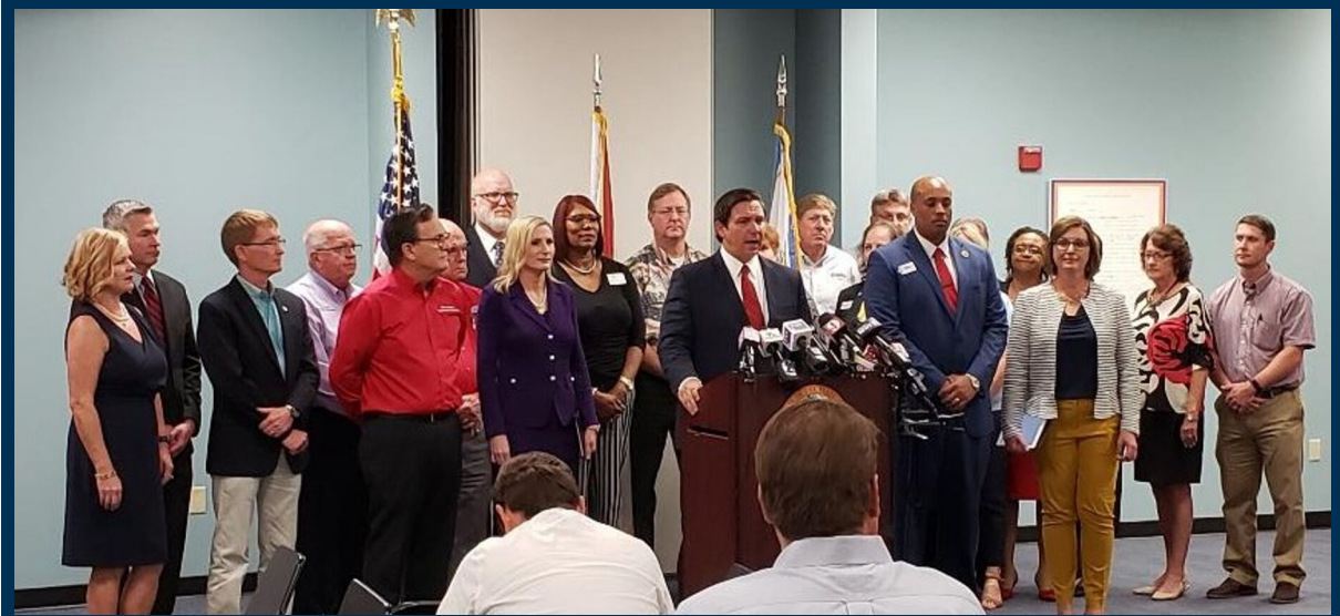
Gobernador Ron DeSantis (centro), Secretaria de Estado, Laurel Lee (izquierda), y varios Supervisores de Elecciones de la Florida en una conferencia de prensa en Orlando, Florida el 21 de Agosto del 2019, anunciando que el estado de la Florida ingresará a ERIC.

Para aumentar la seguridad y la integridad de las elecciones, y con el apoyo del Gobernador DeSantis y de todos los 67 Supervisores de Elecciones, Florida ingresará al Centro de Información de Inscripción Electrónica (en inglés Electronic Registration Information Center, o ERIC). Siendo el miembro más grande que ingresa a ERIC, Florida podrá verificar los registros de inscripción de electores con otros 29 estados miembros para identificar inscripciones duplicadas e inscripciones desactualizadas de electores que se han mudado o han fallecido, generando listas de inscripción de electores más limpias y exactas.